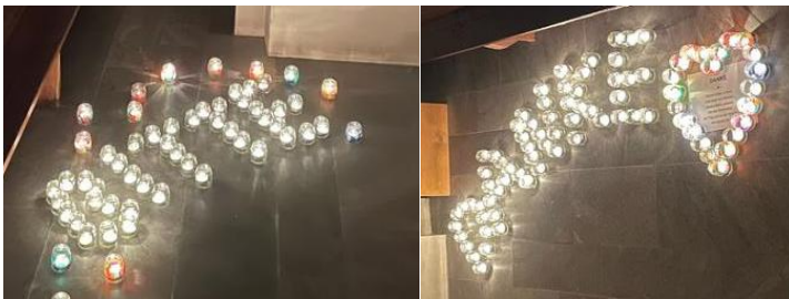
Bilder von der Nacht der 1000 Lichter am 31.10. in der Pfarrkirche Winklern

Feber: Gottes Gegenwart stärke alle Menschen, die durch ihr stilles Gebet die Freuden und Nöte der Kirche und Welt vor Gott tragen.