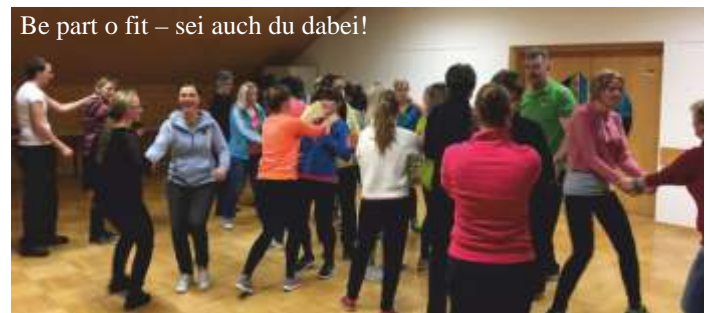
Be part o fit – sei auch du dabei!