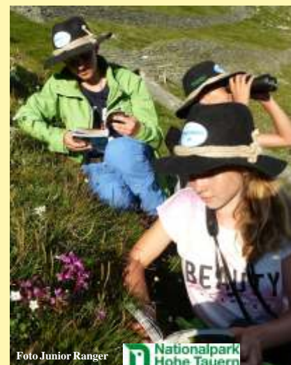
Foto Junior Ranger