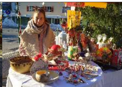
Unser Stand beim Adventmarkt in Winklern