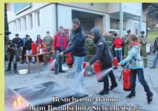
Besucher in Aktion beim Brandschutz Sicherheitstag

Vorschau: 30. April 2016 – Maibaum Aufstellen beim Feuerwehrhaus Reintal