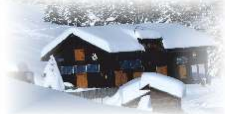
Besinnliche Festtage, verbunden mit den besten Glückwünschen für ein gesundes, friedliches Neues Jahr! Herzlichst Christine Lackner

abzuführende 1,1 %ige Eintragungsgebühr beim Grundbuch. Bei Grundstücksveräußerungen ist noch zu beachten, dass die mit 01.04.2012 eingeführte Immobilienertragsteuer auf Verkäuferseite eine Erhöhung von 25 % auf 30 % vom Veräußerungsgewinn bringen wird. Für weiterführende Auskünfte stehen Ihnen die Notare in Ihrer Umgebung im Rahmen einer ersten kostenfreien Beratung gerne zur Verfügung.