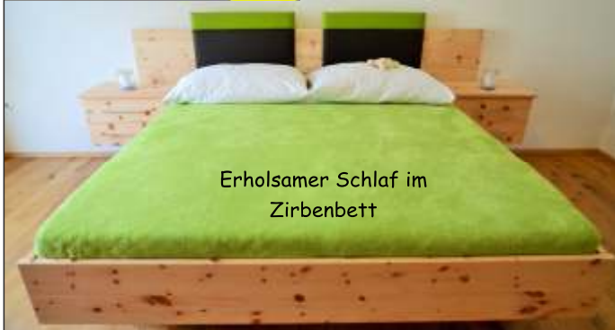
Erholsamer Schlaf im Zirbenbett

www.tischlerei-lerchbaumer.at 9841 Winklern 55 04822/7320